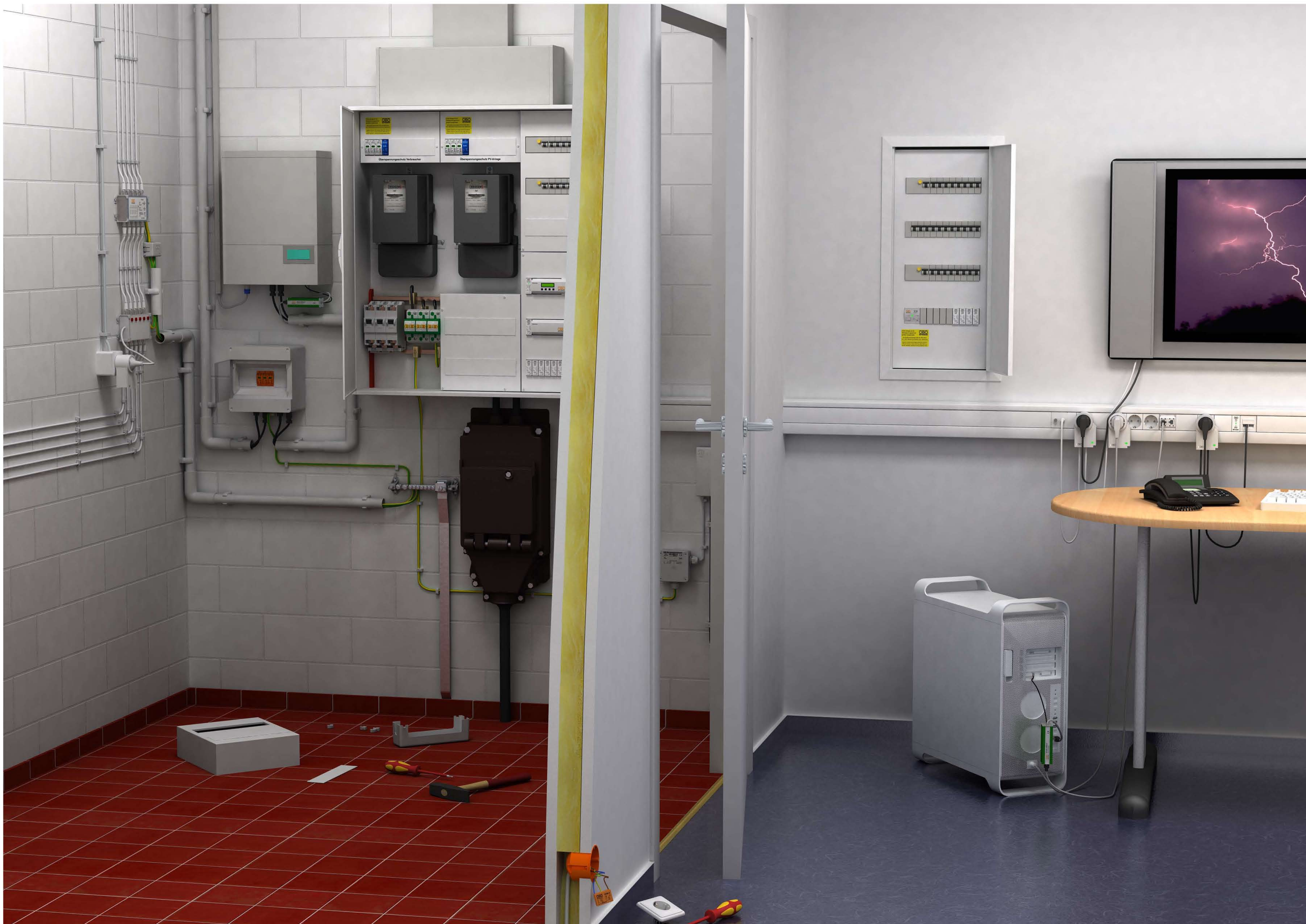
Κλάση προστασίας T1 Στην κεντρική τροφοδοσία ηλεκτρικού ρεύματος